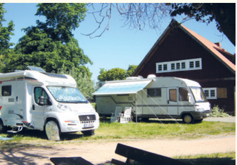
Caravan-Stellplatz in der Hansestadt Seehausen (Altmark) in attraktiver Lage direkt an der Touristinformation und in unmittelbarer Nähe der Altstadt.

Unser Gastgeberverzeichnis und weitere ausführliche Informationen zur Verbandsgemeinde Seehausen (Altmark) mit Ihren sehens- und besuchenswerten Orten erhalten Sie in der Touristinformation Seehausen oder auch im Internet unter: