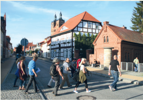
Sommerabendliche Stadtführung in der Altstadt.

Das Angebot an Radwandertouren und Stadtführungen erfragen Sie am besten direkt in der Touristinformation Seehausen.